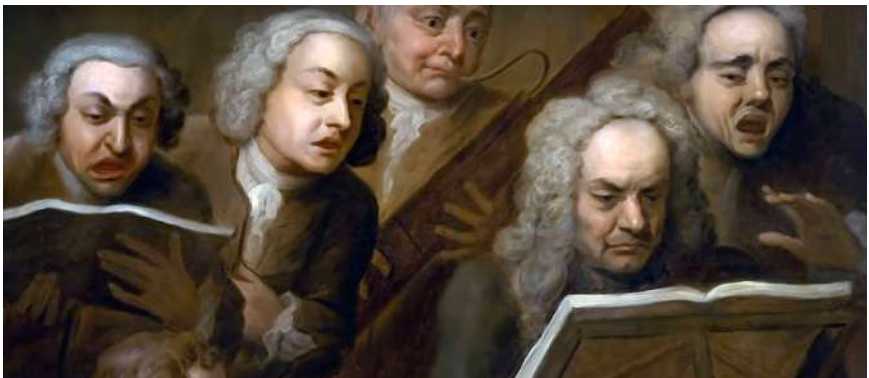
Group of musicians, painting by Philippe Mercier

© François Filiatrault, 2023 Translated by John Trivisonno