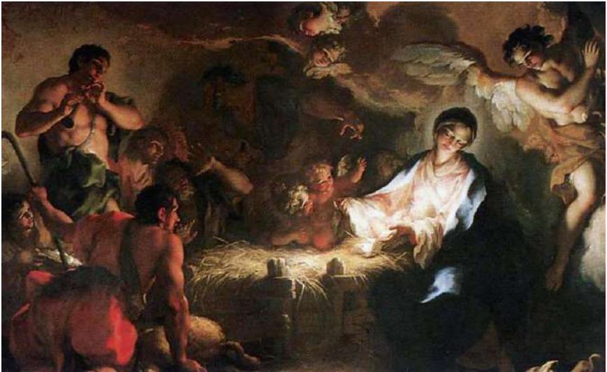
L'adoration des bergers , tableau d'Antonio Balestra, 1707

Il faudra cependant sept autres années avant que Le Messie soit joué sous son titre véritable; en effet, pour ne pas choquer les dévots, on le donnait sous le nom de A Sacred Oratorio . C'est, plus que la musique, le sujet de l'œuvre et le lieu où on la présente, Covent Garden, qui choquent l'esprit puritain de certains Londoniens. Handel la dirige également chaque année au Foundling Hospital, avec le grand castrat Gaetano Guadagni – un des rares de son espèce à avoir adopté un nouveau style plus sobre et pouvant chanter en anglais – dans le rôle de l'alto, et au profit de cette institution qui s'occupe des enfants abandonnés. Cette générosité n'est pas étrangère à l'adoption définitive de l'œuvre par les Anglais, et c'est à partir des dernières années du compositeur qu'elle deviendra vraiment populaire, au point même d'éclipser pour plus d'un siècle presque toutes ses autres compositions, tous genres confondus.