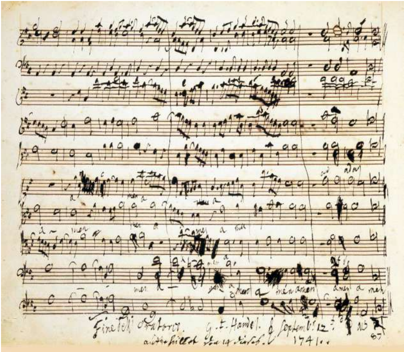
Page manuscrite du Amen final du Messie

Manuscript page of the Final Amen of the Messiah