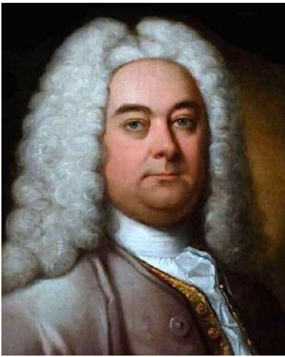
Handel, tableau de William Hogarth (?)

Ce genre, auquel il donnera une ampleur sans précédent, lui permet, par le recours à des sujets bibliques, de parler de la nature humaine dans des termes plus larges que ce qui était possible dans l' opera seria . Il lui permettra également d'exploiter dans leur totalité ses capacités créatrices, demandant l'emploi de toutes les formes possibles d'écriture chorale – rappelons qu'il n'y a pas de chœur dans les opéras italiens. En 1741, Charles Jennens lui propose un texte méditatif, compilation tirée de diverses parties des Ancien et Nouveau Testaments et ayant pour sujet la rédemption de l'humanité par le Messie. Après avoir pris les eaux sur le continent à Aix-la-Chapelle, et avec une volonté de fer qui lui fait vaincre la paralysie qui le menaçait, Handel se met au travail à l'automne de la même année. En trois semaines, la mise en musique du texte est terminée.