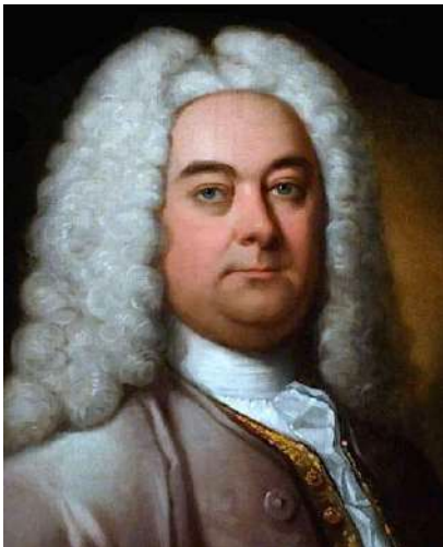
Handel, portrait by William Hogarth (?)

But London showed him the cold shoulder and presented all sorts of difficulties. He therefore decided to take his leave and, as a guest of the Lord Lieutenant of Ireland, set his sights on Dublin, where he had a few friends and acquaintances.