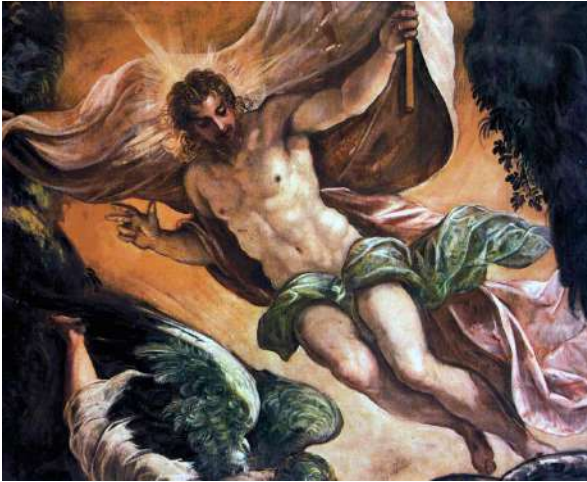
La Résurrection, fresque du Tintoret, v.1580

Contrairement aux autres oratorios de Handel, Le Messie se présente sans action dramatique et sans personnages. Sa trame, qui suit les événements de la vie de Jésus, élabore une méditation en trois volets sur le salut promis aux croyants. Cette absence de drame ne rend pas l'œuvre introvertie pour autant; frémissante, immédiate, hautement visuelle, tous ses détails d'écriture visent l'efficacité et l'adhésion affective.