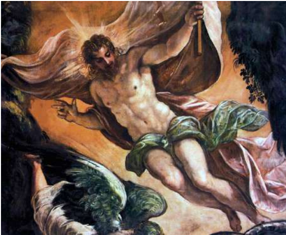
The Resurrection, fresco by Tintoretto, c.1580

As opposed to Handel's other oratorios, Messiah is not dramatic in form and features no characters. Its framework, which follows events in the life of Christ, develops a three-part meditation on the salvation promised to believers. The absence of a dramatic thread does not in any way make Messiah an uncommunicative work; simmering, immediate, and highly visual, all the details of its writing strive for effectiveness and emotional attachment.