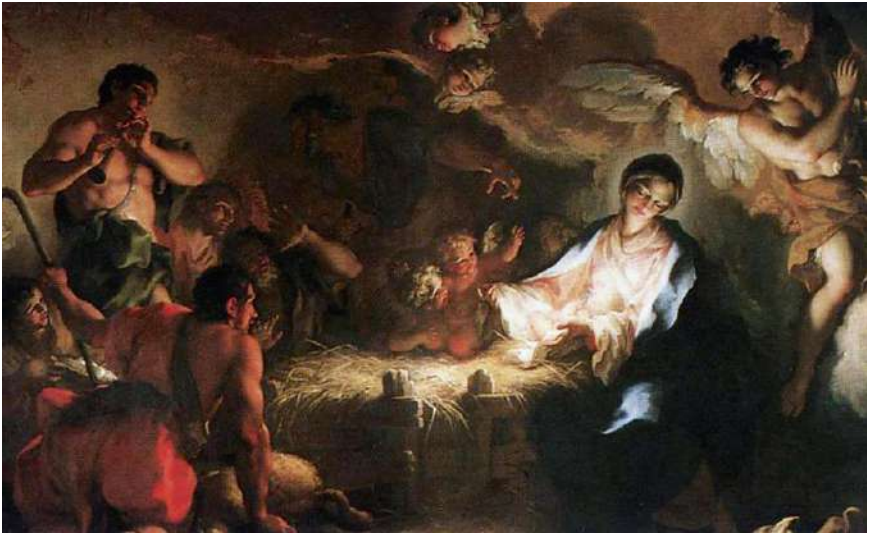
Adoration of the Shepherds, painting by Antonio Balestra, 1707

However, it would be another seven years before Messiah was performed under its true title; to avoid shocking the devout, it had simply been performed under the name A Sacred Oratorio . More than the music, it was the subject of the work and the venue in which it was presented—Covent Garden—that offended the puritan spirit of certain Londoners. Handel also conducted it every year at the Foundling Hospital, with the great castrato Gaetano Guadagni—one of the few of his kind to have adopted a new, more understated style, and who could sing in English—in the alto role, for the benefit of this institution that cared for abandoned children. This generosity played a role in the work's definitive acceptance by the English, and it was in the composer's final years that it became truly popular—to the point of eclipsing almost all his other works in every genre for over a century.